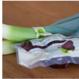
Labels und Standards