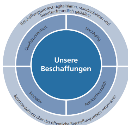
Abb. 1 Stossrichtungen der Beschaffungsstrategie