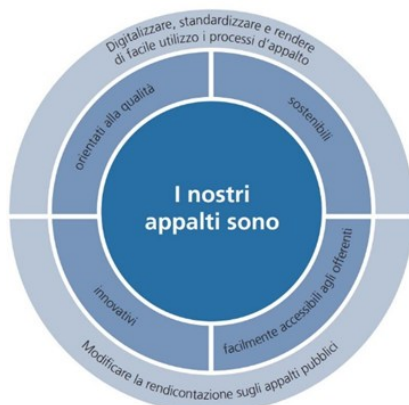
fig. 1 le linee guida seguenti della Strategia in materia di appalti pubblici

Si invitano i membri degli organi direttivi a collaborare ad attuare, nella prassi, le novità del diritto sugli appalti pubblici e a dare forma al cambiamento nella cultura dell'aggiudicazione della Confederazione. 1