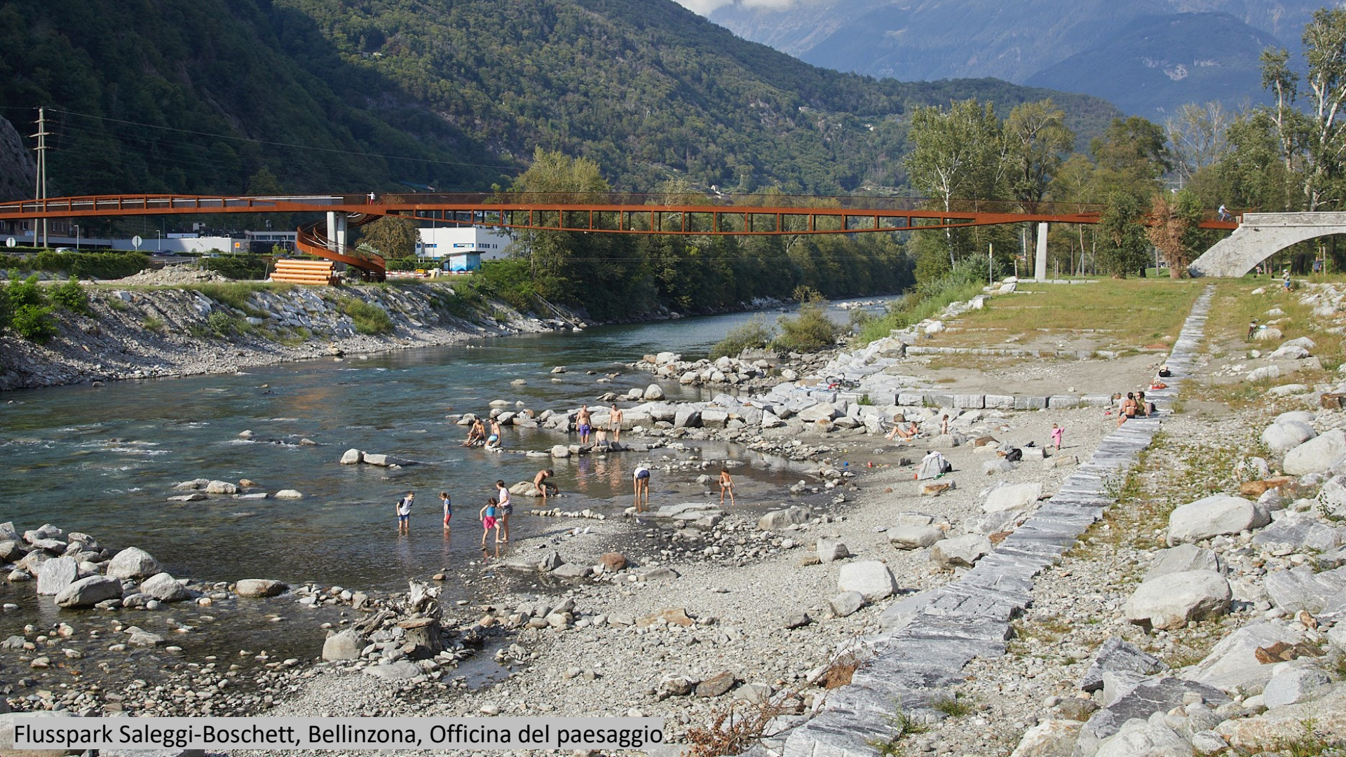
Flusspark Saleggi-Boschett, Bellinzona, Officina del paesaggio