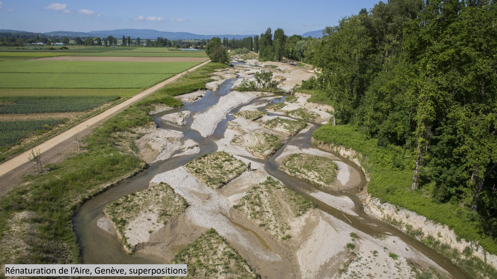
Rénaturation de l'Aire, Genève, superpositions