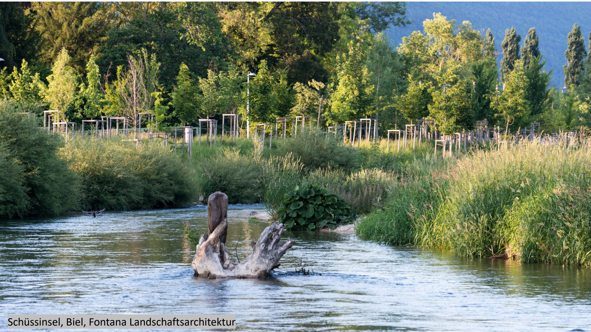
Schüssinsel, Biel, Fontana Landschaftsarchitektur